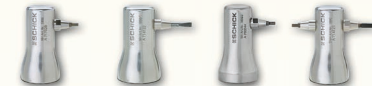
Art.-Nr. 1850 Niethammer