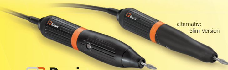
alternativ: Slim Version